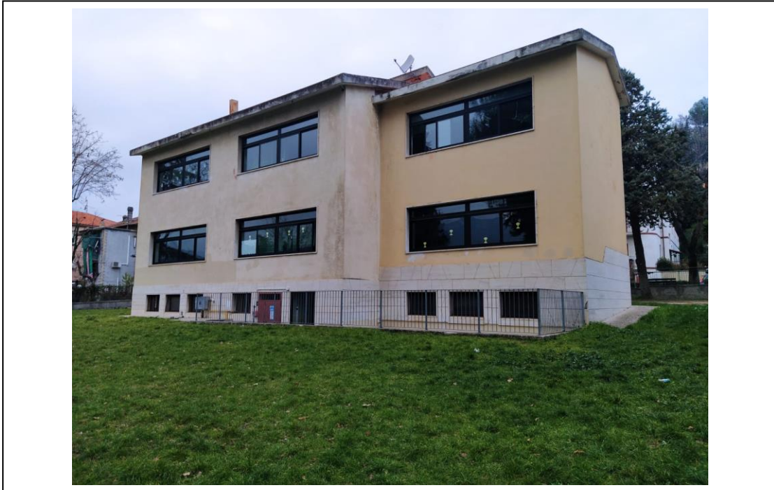
FOTO 4 PROSPETTO NORD-EST