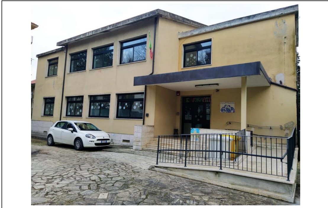
FOTO 2 PROSPETTO SUD-OVEST