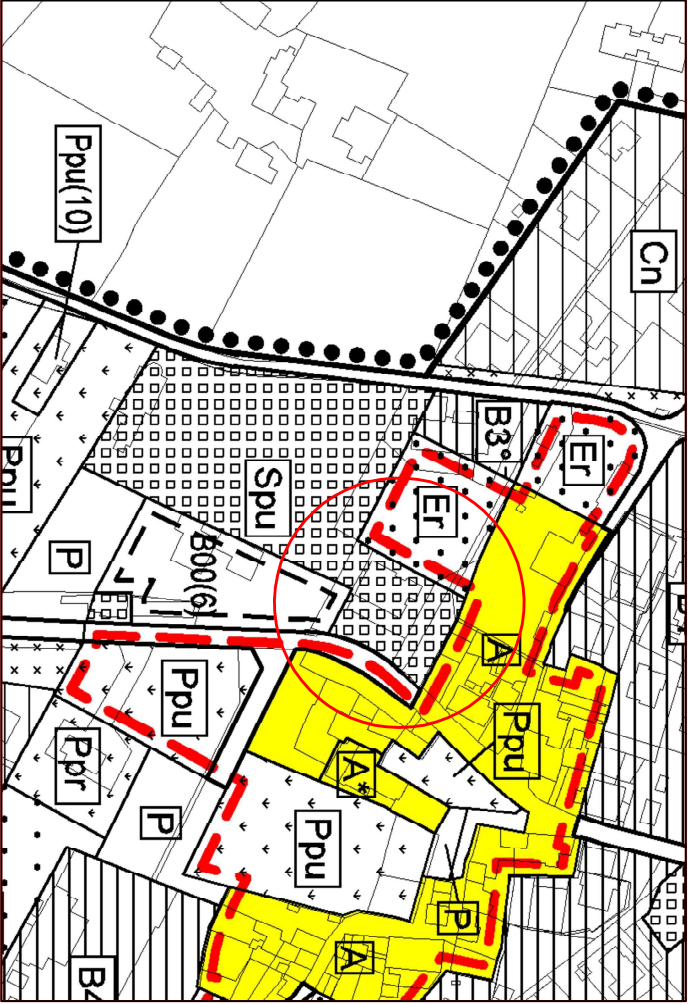
Stralcio Piano Regolatore Generale