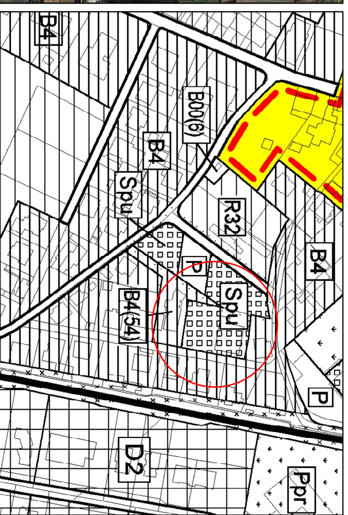
Stralcio Piano Regolatore Generale